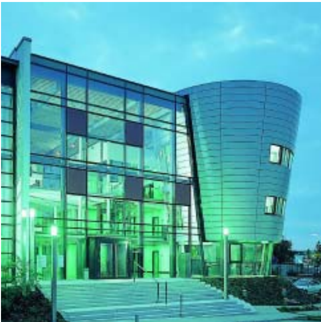
Human solutions im PRE-Park

meen nutzen das Bodyscanning, um Uniformen passgenau zur Verfügung zu stellen. Das Einkleiden benötigt viel weniger Zeit, die Kosten für die Bevorratung von selten benötigten Größen entfallen. Bei der Ergonomiesimulation werden Menschen und ihr Verhalten simuliert, um Produkte schneller, menschengerechter und preiswerter entwickeln zu können. Zu den Kunden gehören fast alle großen Automobilhersteller weltweit, mit dem Ergonomie-Tool RAMSIS ist Human Solutions Weltmarktführer im Bereich Innenraumauslegung von Fahrzeugen. Auch der Innenraum des neuen Airbus 380 wird mit Know-how aus Kaiserslautern gestaltet. Die Zukunftsaussichten für die Produkte von Human Solutions haben die Beteiligungsgesellschaft CornerstoneCapital AG, Frankfurt, überzeugt. CornerstoneCapital hält jetzt 30 Prozent des Kapitals und hat hierfür 2,1 Millionen Euro gezahlt. Weiterer großer Anteilseigner ist die britische Investmentgruppe 3i mit ebenfalls 30 Prozent.