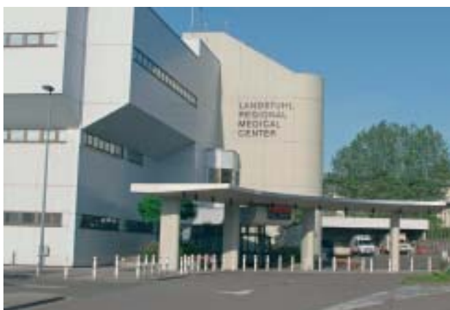
Landstuhl Medical Center der Amerikanischen Streitkräfte