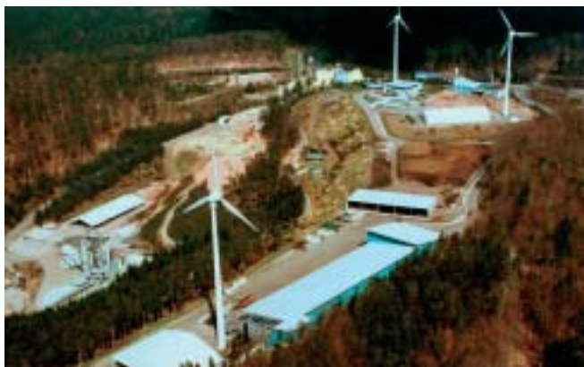
ZAK-Gelände: Entsorger und Energie-Lieferant