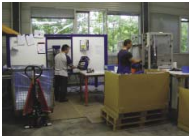
Montageabteilung der Sonima GmbH