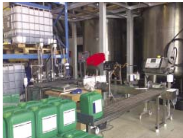
Blick in die Produktionshalle von Lebosol