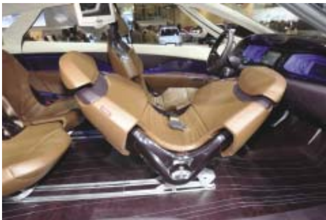
Der neue Swivel Seat von Keiper